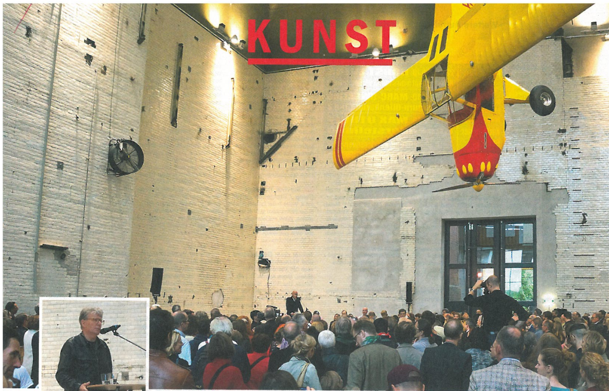
Auf dem Rollberg: Eröffnung des Kindl-Zentrums mit „Kitfox Experimental 2014“ und dem Künstler Roman Signer (links)